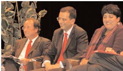
Avec François Hollande à Fontenay-aux-Roses le 17 janvier 2008.