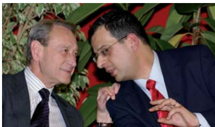
Avec Bertrand Delanoë à Clamart le 23 janvier 2008.